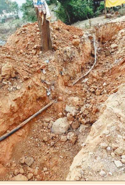
पाइप लाइन में है तकनीकी कसरती

बिभ्रामपुर। ग्राम पंचायत लटोरी के बस स्टैंड समीप कराए जा रहे लापरवाहीपूर्ण नाली निर्माण कार्य से गांव में पानी की किल्लत हो गई है। यहां पर नाली निर्माण के दौरान की गई अव्यवस्थित खुदाई में जल जीवन मिशन की मुख्य पाइपलाइन क्षतिग्रस्त हो गई है। गौरवलाब है जल जीवन मिशन अंतर्गत सरकार द्वारा कई करोड़ रुपये की भारी भरकम राशि खर्च कर आम लोगों का जीवन सुखद बनाने की कोशिश की गई है, लेकिन जमीनी स्तर पर हकीकत कुछ और बर्बाद कर रही है। लटोरी बस स्टैंड समीप पाइपलाइन टूटने ही गांव में जल आपूर्ति पूरी तरह बाधित हो गई और अब हालात यह हैं कि लोग भीषण गर्मी में बूंद-बूंद पानी के लिए मटकने को मजबूर हैं। अप्रैल की झुलसा देने वाली गर्मी में जहां तापमान लगातार बढ़ रहा है, वहीं पानी की कमी ने ग्रामीणों की मुश्किलें कई गुना बढ़ा दी हैं। सुबह होते ही गांव की महिलाएं और बच्चे खतौन लेकर पानी की तलाश में निकल पड़ते हैं। कुछ ग्रामीण हैंडपंप की लंबी कतार में खड़ा होने विवश हैं, तो कोई दूर-दराज के कुआं और नलकूपों से पानी ढोने को मजबूर हैं। ग्रामीणों का कहना है कि पहले घर-घर नल से पानी मिल रहा था, लेकिन पाइपलाइन टूटने के बाद से पूरा सिस्टम बंद हो गया है। लोगों का आरोप है कि नाली निर्माण कार्य बिना किसी तकनीकी मार्गदर्शन और समुचित सर्वे के शुरू कर दिया गया। भूमितल पाइपलाइन की जानकारी लिए बिना ही मशीनों से खुदाई कर दी गई, जिसका खामियाजा अब पूरे गांव को भुगतना पड़ रहा है। पेयजल संकट से त्रस्त ग्रामीणों ने कलेक्टर को ज्ञापन सौंप तत्काल पाइपलाइन की मरम्मत, जल आपूर्ति बहाल करने और नाली निर्माण कार्य को तकनीकी मानकों के अनुसार कराने की मांग की है।