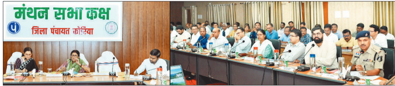
हरिभूमि न्यूज ►► बैकुण्ठपुर

कोरिया और मनेन्द्रगढ़-चिरमिरी-भरतपुर जिला के विकास कार्यों की समीक्षा को लेकर बुधवार को जिला पंचायत के मंथन कक्ष में जिला विकास समन्वय एवं निगरानी समिति दिशा की महत्वपूर्ण बैठक आयोजित हुई। बैठक की अध्यक्षता श्रीमती ज्योत्सना चरण दास महंत ने की। इस दौरान दोनों जिलों के कलेक्टर, पुलिस अधीक्षक, वन विभाग के अधिकारी, जनप्रतिनिधि काफी संख्या में वरिष्ठ अधिकारी उपस्थित रहे। बैठक में सांसद ने साफ शब्दों में कहा कि पेयजल और स्वास्थ्य जैसी बुनियादी सुविधाओं के लिए ग्रामीणों को किसी भी तरह की परेशानी नहीं होनी चाहिए। भीषण गर्मी को देखते हुए उन्होंने अधिकारियों को निर्देश