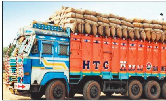
हरिभूमि न्यूज ►► बैकुण्ठपुर

छग राज्य सहकारी विपणन संघ मर्यादित के जिला कार्यालय बैकुण्ठपुर द्वारा बुधवार को समीक्षा रिपोर्ट में खरीद विपणन वर्ष 2025-26 के तहत धान खरीदी और उठाव की प्रगति सामने आई है। जिले में इस वर्ष 21 उपार्जन केन्द्रों के माध्यम से व्यापक स्तर पर धान खरीदी की गई, जिसमें अब तक लगभग पूरा उठाव कर लिया गया है। जिले में समर्थन मूल्य पर कुल 12,08,131 क्विंटल धान खरीदा गया। इसमें से अब तक 11,96,742 क्विंटल 99.06 प्रतिशत धान का उठाव किया जा चुका है, जबकि लगभग 11,389 क्विंटल धान का उठाव शेष है। खाद्य विभाग के अनुसार शेष धान का उठाव 30 अप्रैल तक पूर्ण करने का लक्ष्य रखा गया है। रिपोर्ट के अनुसार जिले को लगभग 13.74 लाख क्विंटल धान खरीदी का लक्ष्य दिया गया था, इसके मुकाबले वास्तविक खरीदी लक्ष्य के काफी करीब रही। उठाव की प्रगति भी संतोषजनक मानी जा रही है, क्योंकि 99 प्रतिशत से अधिक धान पहले ही गोदामों से परिवहन किया जा चुका है। कुल 23,438 किसान पंजीकृत थे, इनमें से 20,442 किसानों ने धान बेचा।