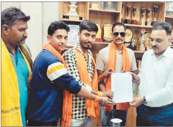
ज्ञापन सौंपते बजरंग दल के कार्यकर्ता व ग्रामीण।