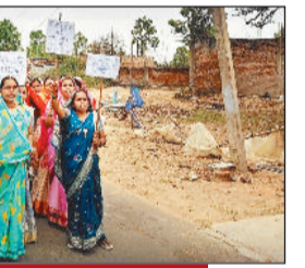
पूर्व में महिलाओं ने निकाली थी रैली

बैकुण्ठपुर। कोरिया जिले के ग्राम जिल्दा में हाल ही में खोली गई शराब दुकान को लेकर विवाद महारात जा रहा है। जिला आबकारी विभाग जहां इसे अपनी उपलब्धि के रूप में पेश कर रहा है, वहीं ग्रामीण इसे प्रशासन की विफलता और मजबूरी का परिणाम बता रहे हैं। ग्रामीणों का कहना है कि क्षेत्र में लंबे समय से अवैध शराब का कारोबार फल-फूल रहा था। मध्यप्रदेश से शराब लाकर ऊंचे दामों पर बेची जा रही थी और कोचियों के सिंडिकेट के जरिए यह धंधा संचालित हो रहा था। ऐसे में उम्मीद थी कि प्रशासन अवैध गतिविधियों पर सख्त कार्रवाई करेगा, लेकिन इसके उलट गांव में वैध शराब दुकान खोल दी गई। गांव की महिलाओं ने इस फैसले पर कड़ा विरोध जताया है। उनका कहना है कि शराब की आसन उपलब्धता से युवाओं में नशे की लत बढ़ेगी, घरेलू हिंसा और पारिवारिक कलह जैसी समस्याएं और बढ़ेंगी। महिलाओं का कहना है कि वे इस दुकान के पक्ष में नहीं थीं,